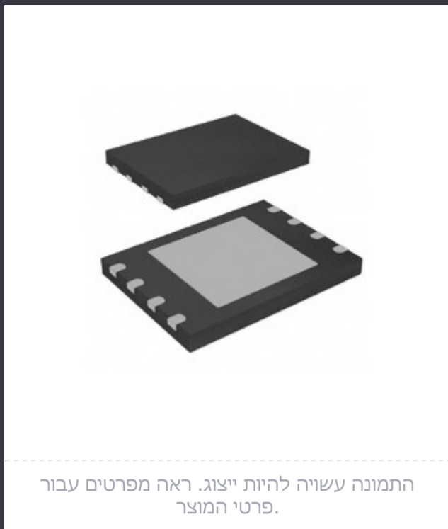
התמונה עשויה להיות ייצוג. ראה מפרטים עבור פרטי המוצר.