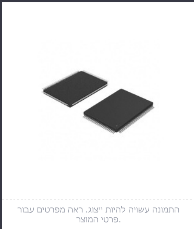
התמונה עשויה להיות ייצוג. ראה מפרטים עבור פרטי המוצר.