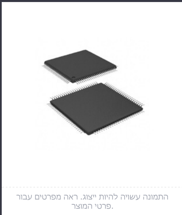
התמונה עשויה להיות ייצוג. ראה מפרטים עבור פרטי המוצר.